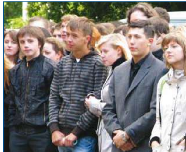
Начало 2008 – 2009 учебного года в ИГЭУ (стр. 2)