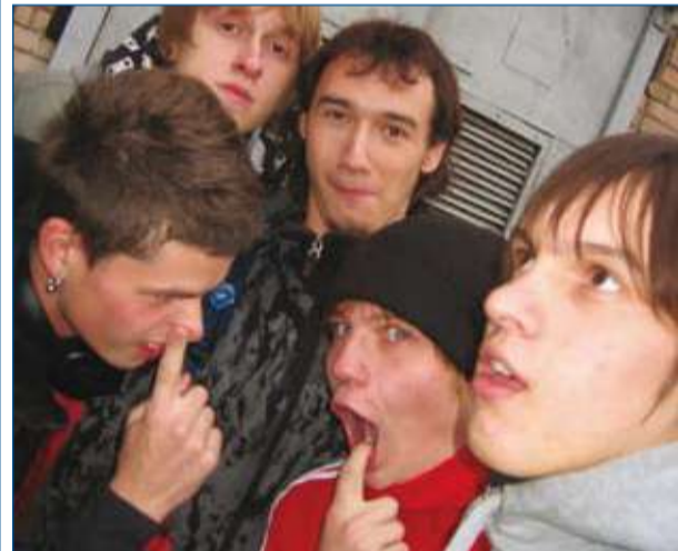
Звезды ИГЭУ: их надо знать в лицо! (стр. 6)