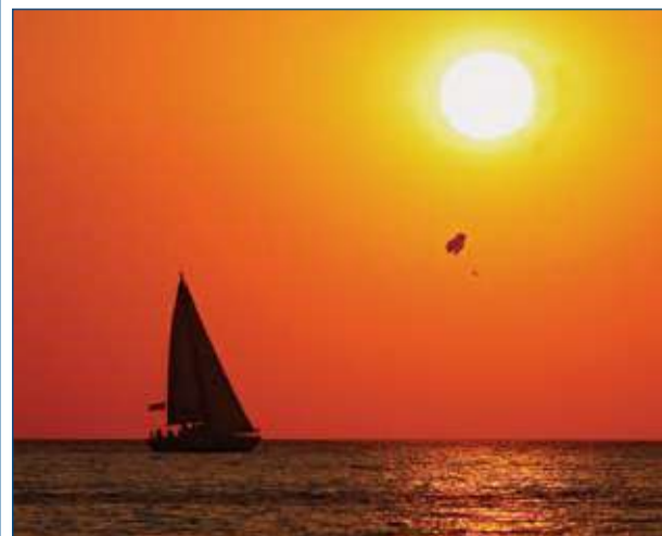
Ностальгия по лету, или как мы умеем отдыхать (стр. 8)