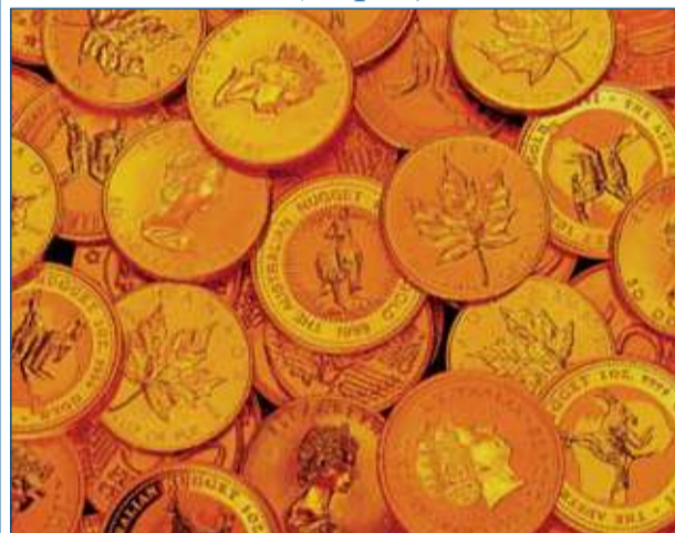
Лидерство не купишь! (стр. 7)