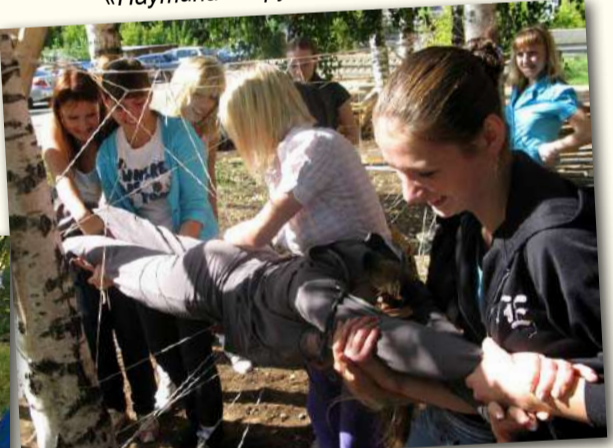
«Паутина»: в руках собратьев...

Р. С. Подведение итогов прошедшего конкурса пройдет на втором этапе, концерте «Посвящение в студенты», который пройдет в конце октября.