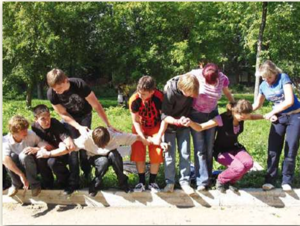
«Скала»: новая альпинистская система!

Вот уже третий год старшие собраты-студенты проводят для молодого поколения ИГЭУ «Веревоочный курс» (сокр. «Веревоочка»). Идею его проведения ребята, представители профбюро, почерпнули из многочисленных встреч в Школах актива, на которые собираются студенты со всей России. Появилась «Веревоочка» в середине XX века в США. Существуют две версии происхождения: либо он был разработан для армии (реабилитация военнослужащих), либо был