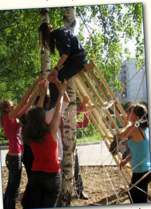
«Паутина»... и здесь альпинисты!

му чувствительному товарищу из группы нужно было пройти путь с закрытыми глазами, ориентируясь только на слабые шорохи, звуки и запахи. «Узник»: друзья Оушена в своей ловкости просто отдыхают на фоне наших первокурсников, выкручивающихся из веревочных наруч-