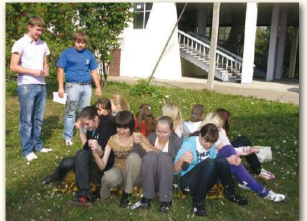
«Ромашка»... Милый цветок!

му чувствительному товарищу из группы нужно было пройти путь с закрытыми глазами, ориентируясь только на слабые шорохи, звуки и запахи. «Узник»: друзья Оушена в своей ловкости просто отдыхают на фоне наших первокурсников, выкручивающихся из веревочных наруч-