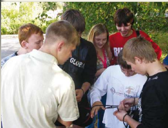
«Узник»: скованные одной цепью!..

«Паутина»: ребята должны были пролезть через настоящую паутинку из веревок без единого касания, чему часто мешали капюшо-