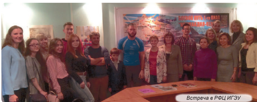
Встреча в РФЦ ИГЭУ